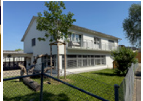
Attraktive Unterrichtsräume und eine Attraktion im Untergeschoss: Der Rhythmik-Raum lässt die Kinder ihren journalistischen Auftrag vergessen...

Viele Männer, die Lehrer sein wollen, unterrichten grosse Kinder. Dort hat es viele Lehrer. Bei jüngeren Kindern sind es oft Frauen. Das heisst, liebe Jungs, werdet Lehrer. Ihr braucht mehr Lehrer. Als ich in der Lehrerinnen-Schule war, gab es nur 10 Lehrer. Und 200 Frauen.