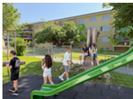
Die Umgebung des Schulhauses Dammstrasse lädt zum Spielen ein.

Vesna Belos: Aber auch Papas haben doch gerne Kinder. Auch Papas passen gerne auf Kinder auf. Nein, es gibt keinen wirklichen Grund.